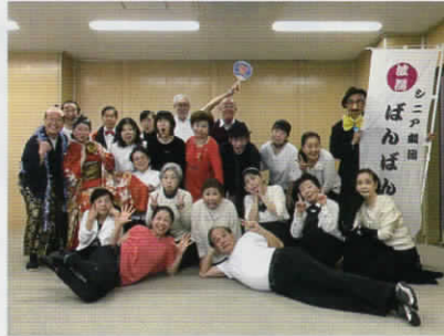
シニア劇団「波瀾ばんばん座」